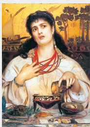
Hämnd. Anthony Frederick Sandys Medea (1868).

KÖNSROLLER. I Euripides drama Medea förklarar Jason för sin övergivna hustru varför han beslutat byta ut henne mot kungadottern i Korint: Medea har visserligen räddat hans liv, svikit sin far och sitt fädernesland och mördat sin bror för kärleken till honom, men några tacksamhetsförpliktelser därvidlag erkänner han inte. Därtill framhåller han att Medea ska betänka att han genom sitt nya gifte kan ge sig själv och deras gemensamma söner en plats i samhället som bättre svarar mot hans egen börd. Således bör tacksamheten snarare ligga hos Medea, som snarast bör lämna landet eftersom hennes närvaro där besvärar hans nya hustru och hennes familj.