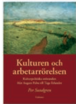
Inbunden, i utvald, 391 sidor PER SUNDGREN