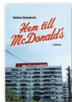
HELENE BREMBECK Inbunden, i utvald, 189 sidor

Där människor vill vara, dit kommer McDonald's. I sina annonskampanjer framställer sig företaget som en del av det svenska, med inhemska värderingar. Här visar författaren exempel på hur globala företag aktivt jobbar för att bli en naturlig del av människors liv; hur de får sina kunder att ha sina »vardagliga relationer i och genom den globala ekonomin».